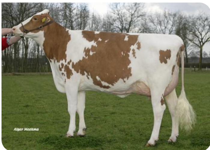
Grashoek Silke 80 (VG 87) (Großmutter von Moneymaker rf)