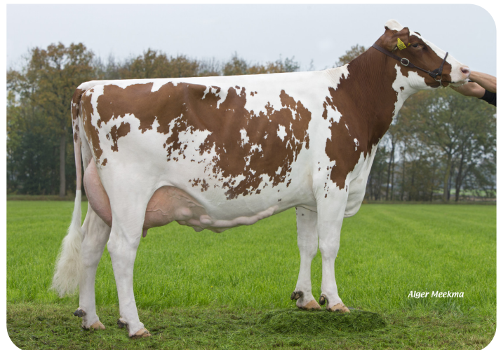
Grashoek Silke 136 (VG 85) (Mutter von Moneymaker rf)