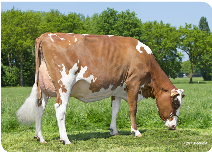
Grashoek Silke 200 (VG 85) (V. Moneymaker rf) Bes.: Melkveebedrijf Grashoek b.v., Grashoek (NL)