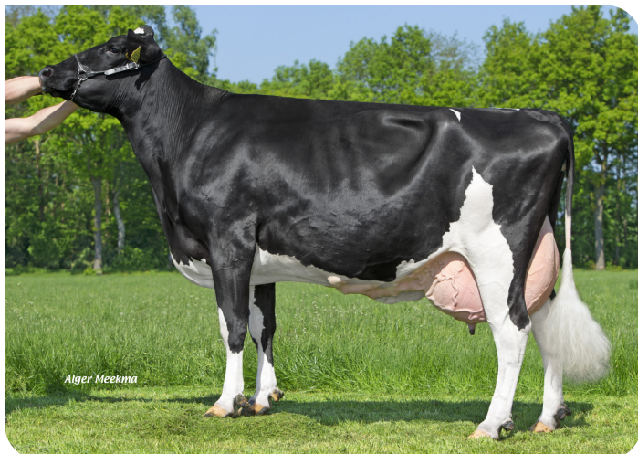
Desibon 32 (VG 87) (Mutter von Mareno)