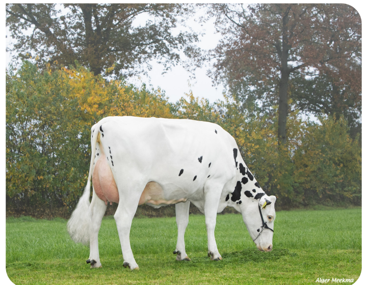
Quarrel 54 (V. Mareno) Bes.: Mts. Steenblik-Tetteroo, Ruurlo (NL)