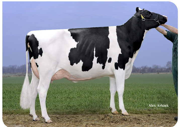
Drouner AJDH Aiko (VG 87) (Mutter von Kentucky (Pp))