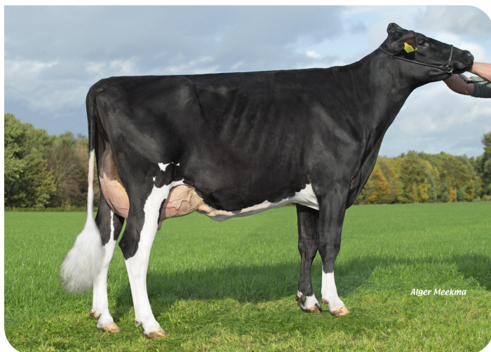
Grashoek Nel 193 (V. Kentucky (Pp)) Bes.: Melkveebedrijf Grashoek, Grashoek (NL)