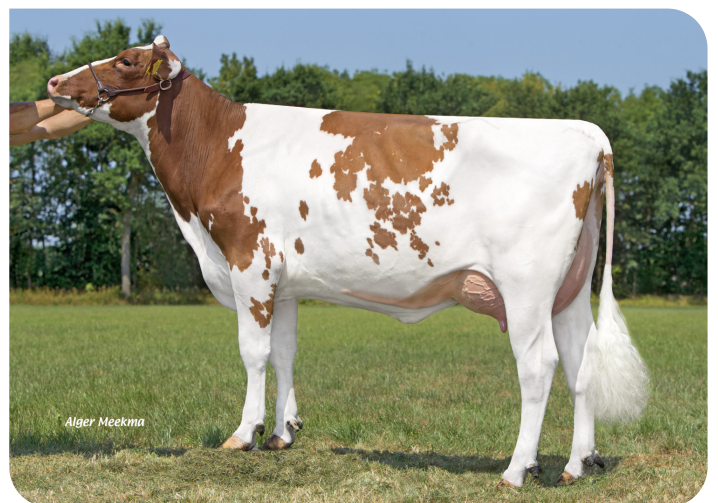
Grashoek Aiko 3 PP (Vollschwester von Kentucky (Pp)) Bes.: Melkveebedrijf Grashoek b.v., Grashoek (NL)