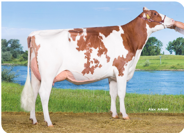
Drouner AJDH Aiko 1288 (VG 88) (Halbschwester von Kentucky (Pp))