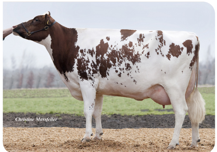
RH Meggy-J (VG 88) (Mutter von Gandalf)