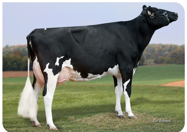
Fourdiamondb Shot Rasine (EX 90) (Mutter von Royal Rex)