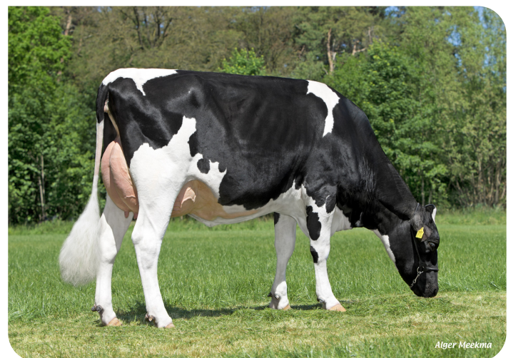
Trix 95 (V. FaWi Caruso)