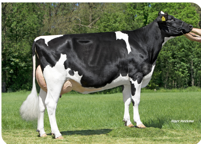
Trix 95 (V. FaWi Caruso)