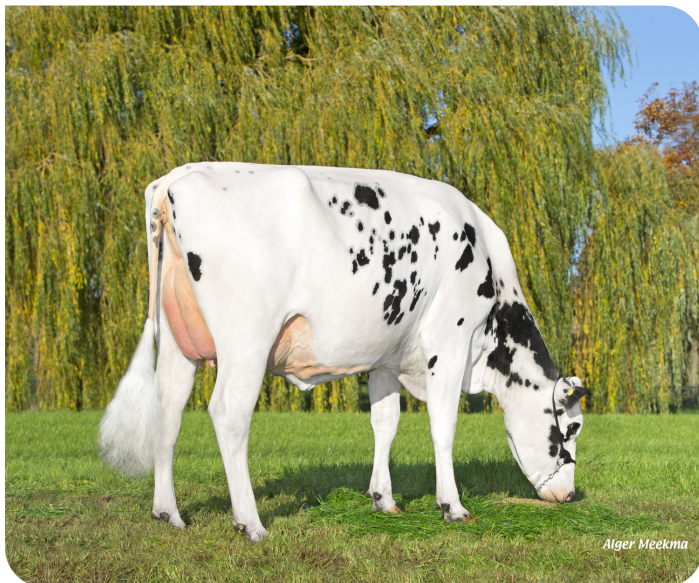
Jansje 684 (V. FaWi Caruso) Bes.: Firma de Groot, Everdingen (NL)