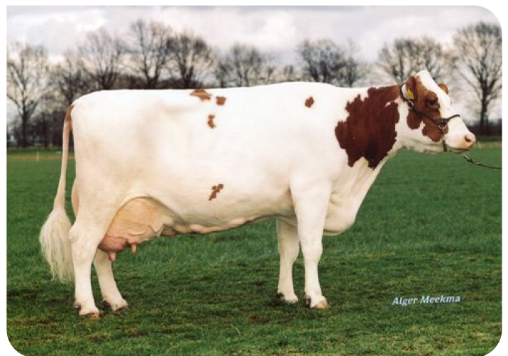
Dz Mies 118 (VG 86) (Großmutter von Thijmen)