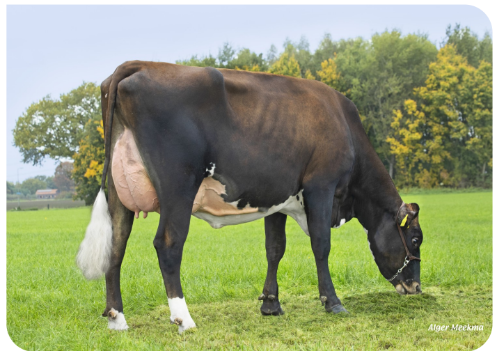
Grashoek Tonnie 108 PP (V. Aras, 75% HF, 25% BS) (VG 85) Bes.: Fok- en melkveebedrijf K.I. SAMEN, Grashoek