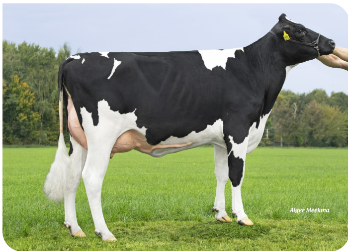
Grashoek Becky 45 (VG 86) (V. Aras) Bes.: Fok- en melkveebedrijf K.I. SAMEN, Grashoek