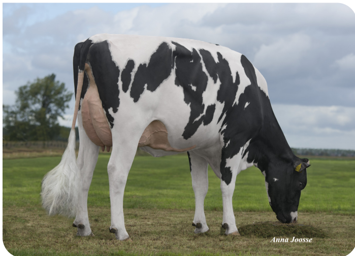
De Volmer DG Caylee (VG 86) (Großmutter von Casimir)