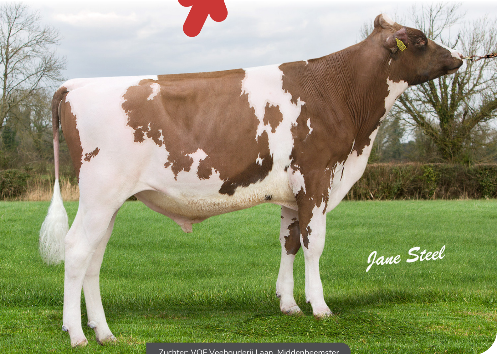
Zuchter: VOF Veehouderij Laan, Middenbeemster