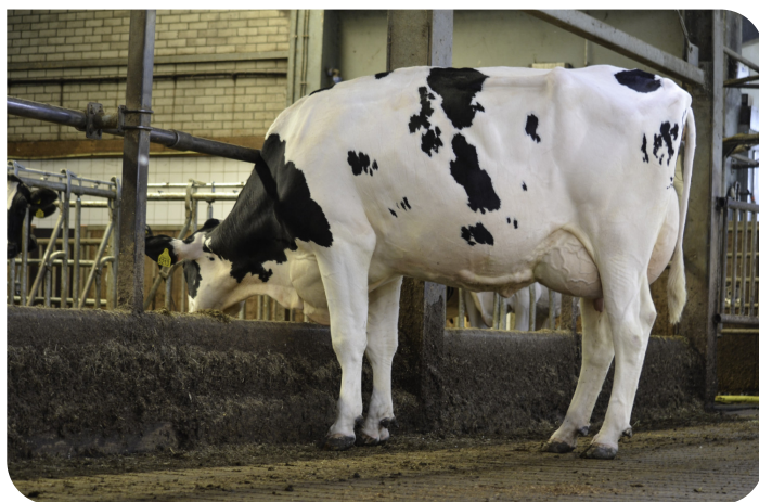
DG OH Daniella (VG85) Mutter von Donte