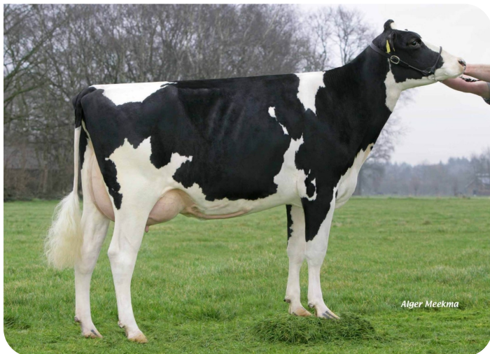
Holbra Manoa (VG85) Ur-Urgroßmutter von Donte