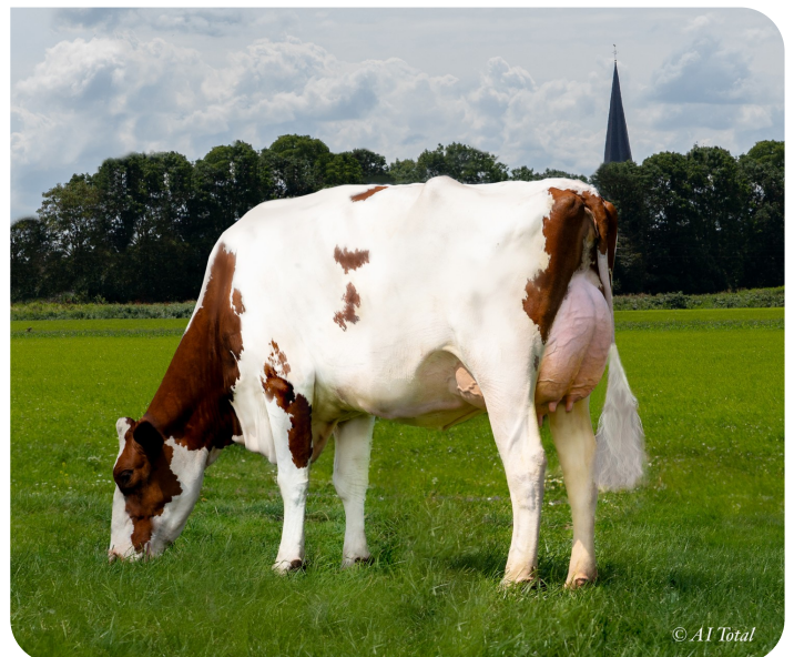
DG R Aliena Red (V. Solitair P)