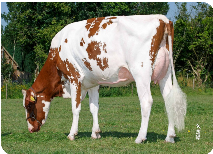
DG R Adalyn Red (v. Endco Argo) Großmutter von Antheum Red