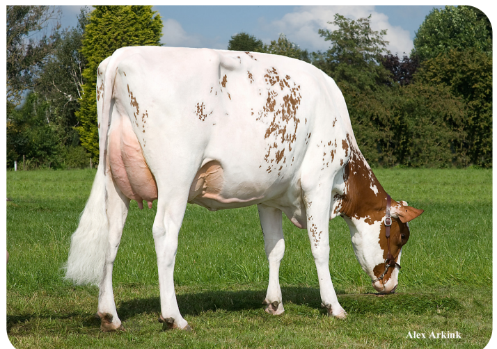
JK Eder All P Red (VG 86) (Mutter von All Star rf (PP))