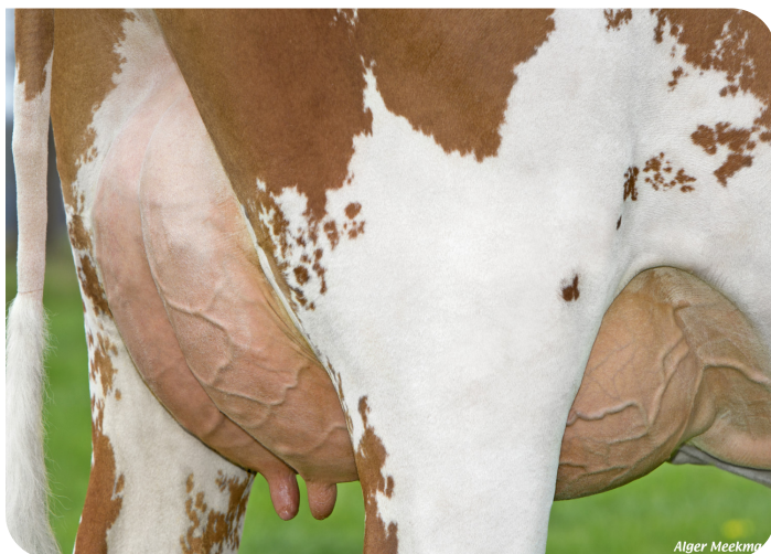
Euter von Sonja 102 (v. All Star rf (PP)) Bes.: Klein Wassink J.B. & Alefs I.M.H., Ruurlo (NL)

2.01 549 Tg. 12982 kg 5.03% 4.15% 5.02 421 Tg. 10939 kg 4.74% 3.89% 89 88 86 88 VG 87