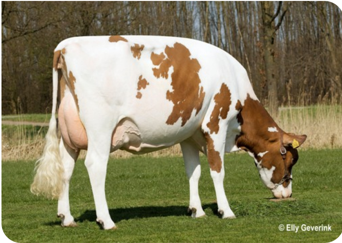
De Vlottenburg Joze 216 (V. Abel) Bes.: Mts. Gieling-Heijltjes, Babberich (NL)