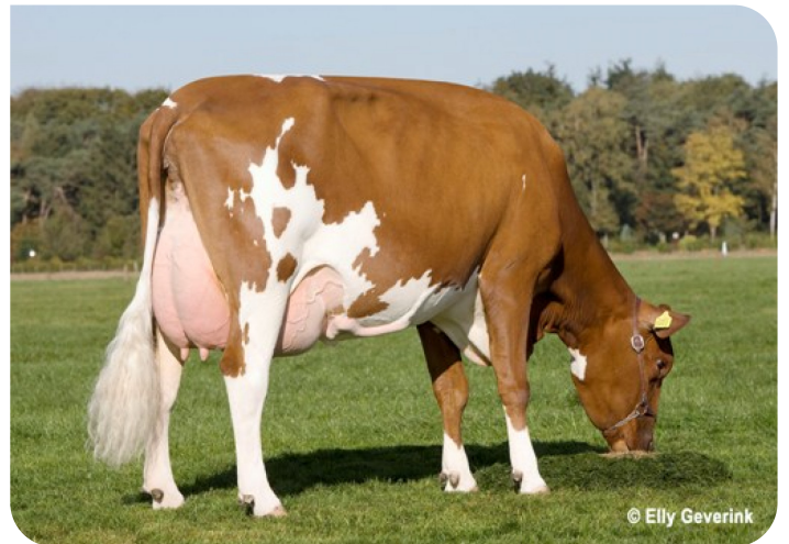
Hallerdijk Julia 6 (V. Abel) (foto nach 2 Abkalbungen) Bes.: V.O.F. D.G. Groot Nibbelink, Halle (NL)