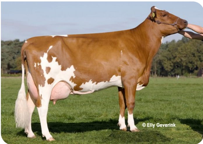
Hallerdijk Julia 6 (V. Abel) (foto nach 2 Abkalbungen) Bes.: V.O.F. D.G. Groot Nibbelink, Halle (NL)