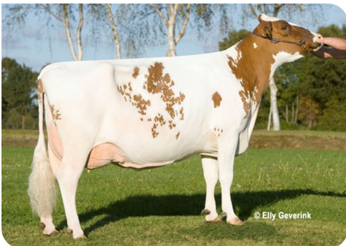
Betsie 68 (V. Abel) (foto nach 2 Abkalbungen) Bes.: Mts. Steenblik-Tetteroo, Ruurlo (NL)