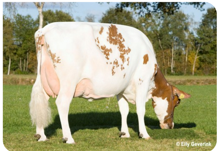
Betsie 68 (V. Abel) (foto nach 2 Abkalbungen) Bes.: Mts. Steenblik-Tetteroo, Ruurlo (NL)