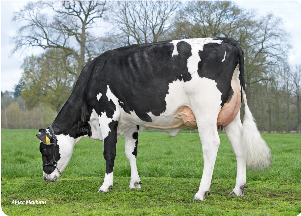
S Floortje 45 (V. Tedbull) Bes.: Mts. Slaghekke, Hengevelde (NL)