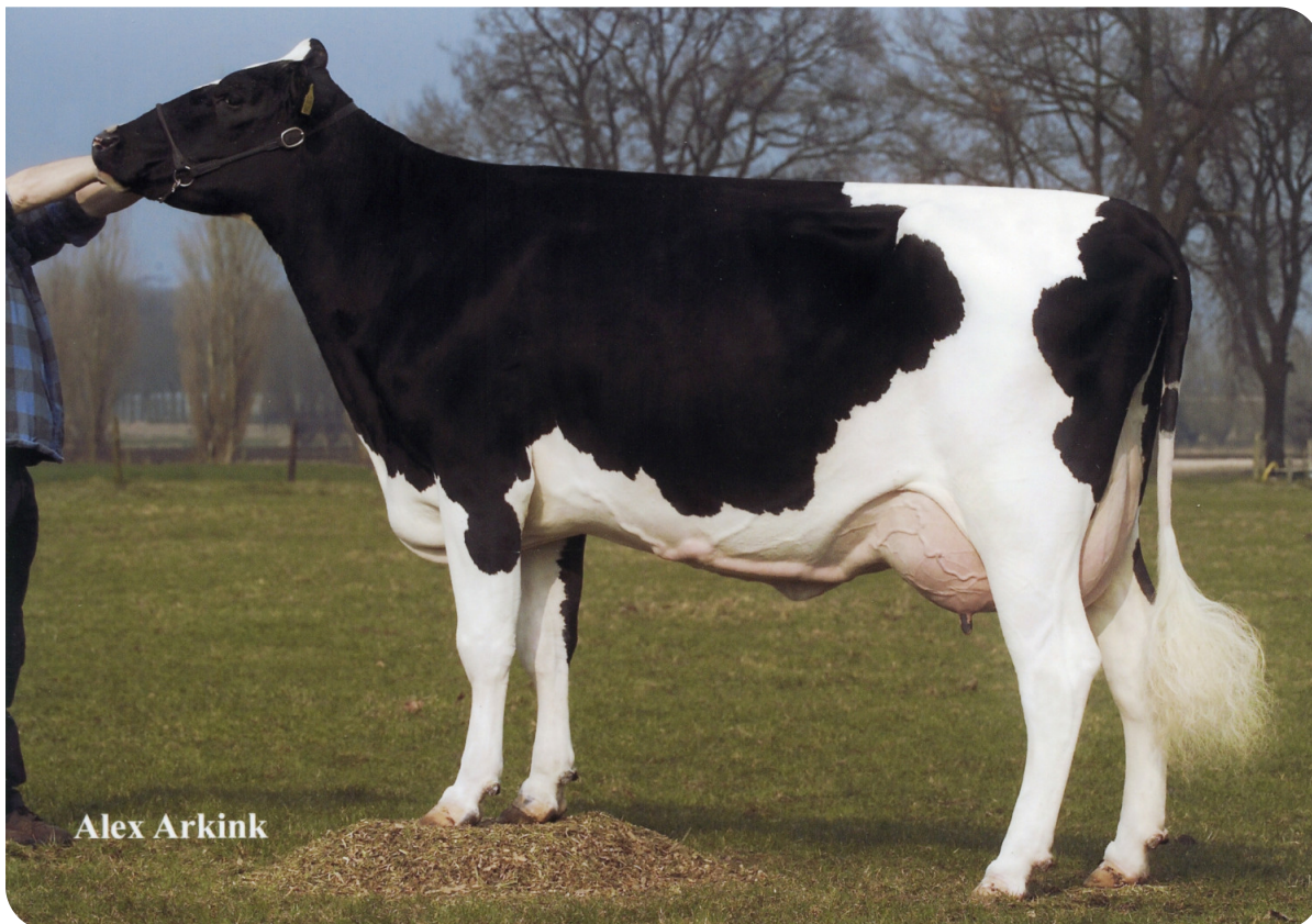
De Rith Tetje 119 (EX 90) (Großmutter von Tedbull)