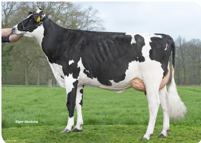
S Floortje 45 (V. Tedbull) Bes.: Mts. Slaghekke, Hengevelde (NL)