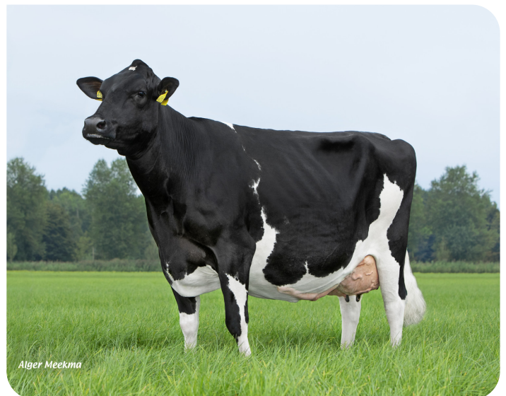
De Nautena Anna 129 (VG 88) Vollschwester von Meester