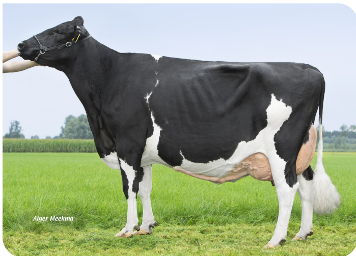
De Nautena Anna 129 (VG 88) (Großmutter von Bianchi)