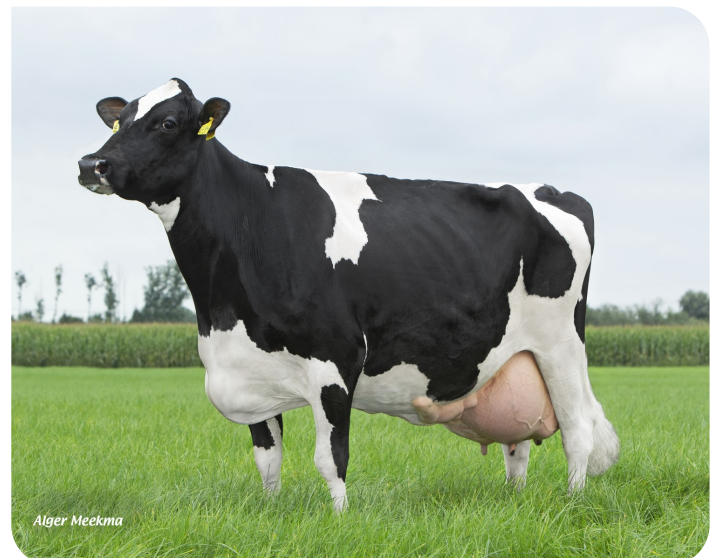
De Nautena Anna 121 (VG 87) (Urgroßmutter von Bianchi)