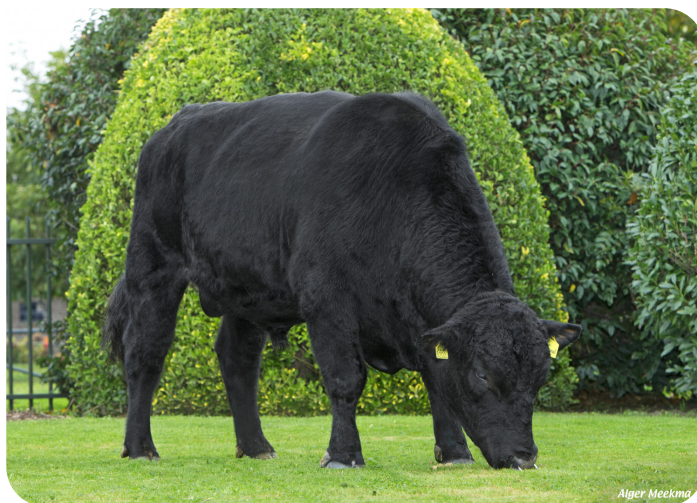
De Crob Admiral 3202