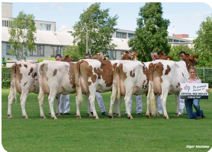
Töchtergruppe Red Reflex NRM 2008