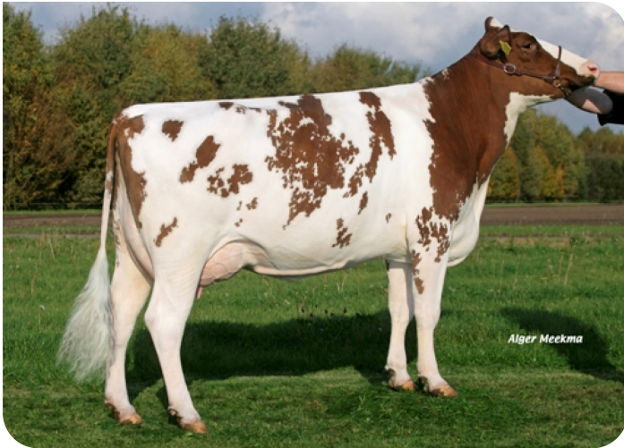
Roosje 275 (B+84) (V. Red Reflex)