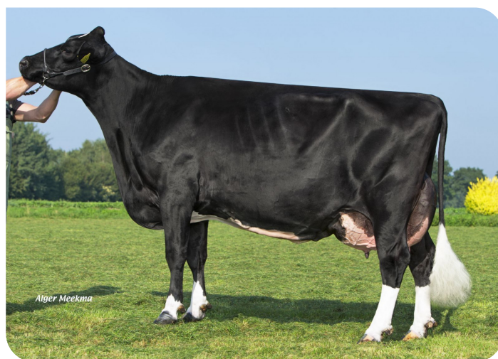
Grashoek Iva 4 (V. Cracker W rf) (foto nach 3 Abkalbungen) Bes.: Melkveebedrijf Grashoek b.v., Grashoek (NL)