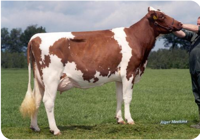
Ruth 31 (VG 88) (Vollschwester von Cracker W's Großmutter)