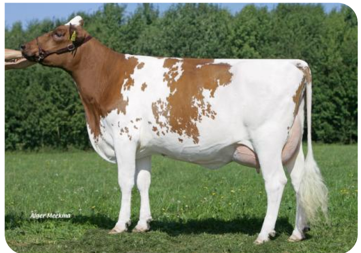
Grashoek Lamberthie 31 (V. Cracker W rf) Bes.: Mts. Bos Dairy, Veenoord (NL)