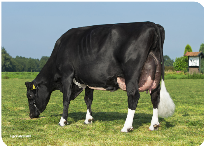
Grashoek Iva 4 (V. Cracker W rf) (foto nach 3 Abkalbungen) Bes.: Melkveebedrijf Grashoek b.v., Grashoek (NL)