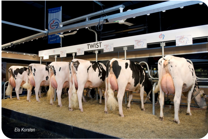
Nachzuchtgrup von Twist Venray 2014