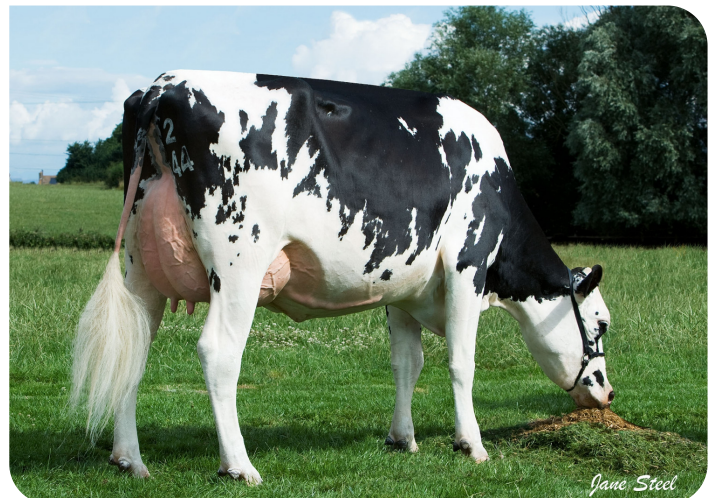
Combwich Twist Elly (Tochter von Twist)