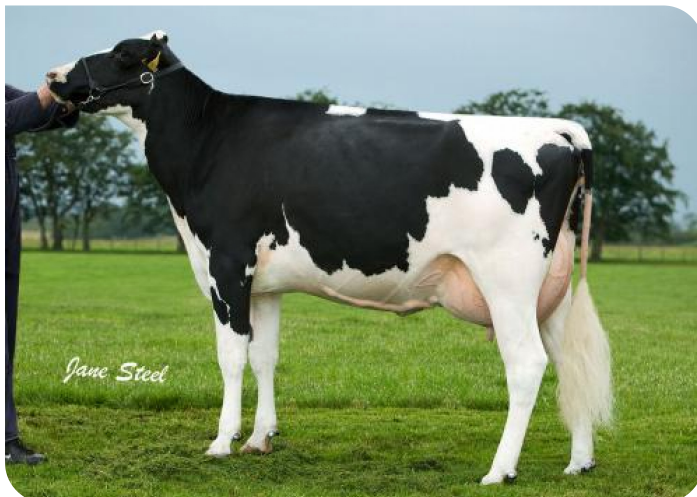
Netherholm Twist Grace (EX 90) (V. Twist)