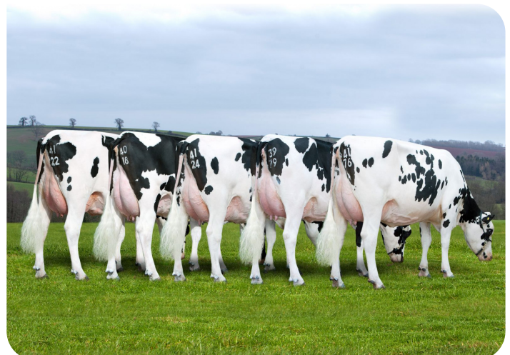
Hillbarton Twist Töchter (V. Twist)