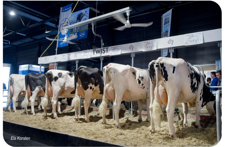
Nachzuchtgrup von Twist Hardenberg 2015