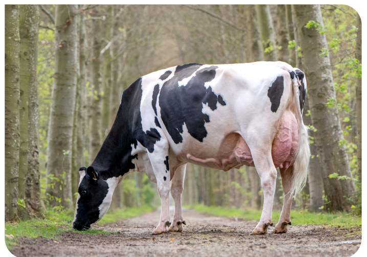
Broeklander Chrispen 2 Mutter von Edjurre