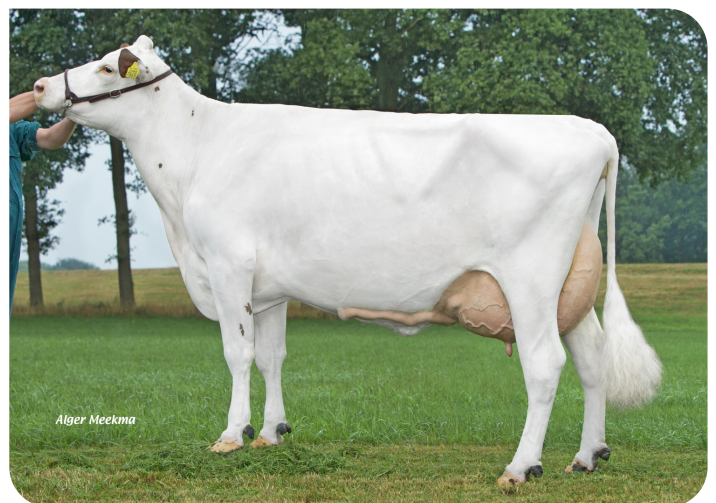
Roza 511 (VG 87) Mutter von Melle Red