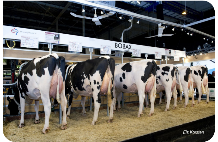
Bobax Töchtergruppe Gorinchem 2014