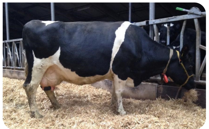
Beitske 293 Mutter von Bouwe 9