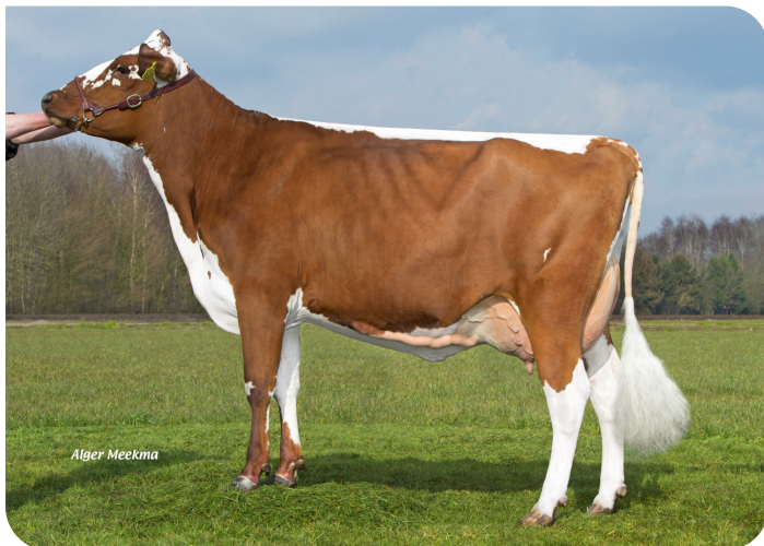
Grashoek Ridderzuring (V. Boomerang) Bes.: Melkveebedrijf Grashoek b.v., Grashoek (NL)