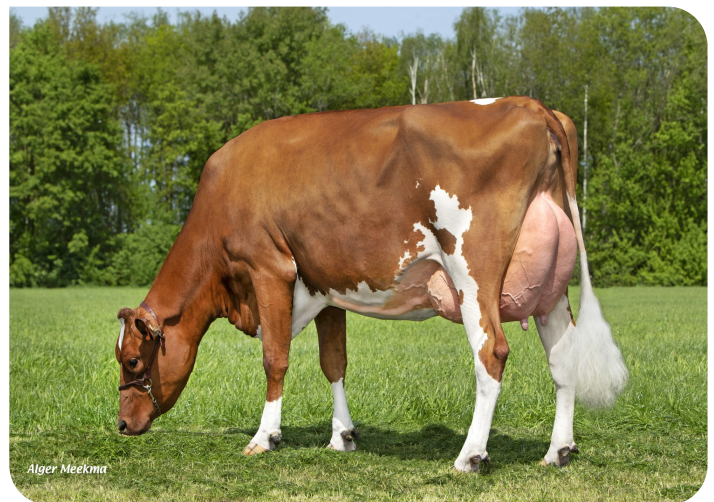
Grashoek Nordika 25 (V. Dex) Bes.: Fok- en melkveebedrijf K.I. SAMEN B.V., Grashoek (NL)