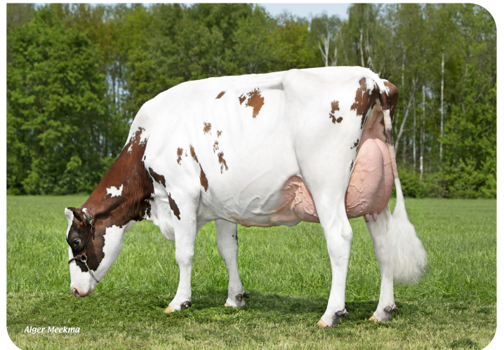
Grashoek Anna-Jacoba 13 (V. Dex) Bes.: Fok- en melkveebedrijf K.I. SAMEN B.V., Grashoek (NL)