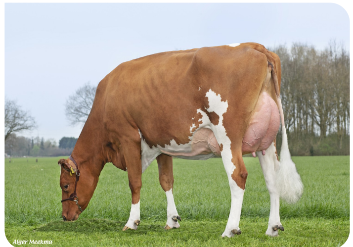
Grashoek Nordika 25 (V. Dex)

Bes.: Fok- en melkveebedrijf K.I. SAMEN B.V., Grashoek (NL)