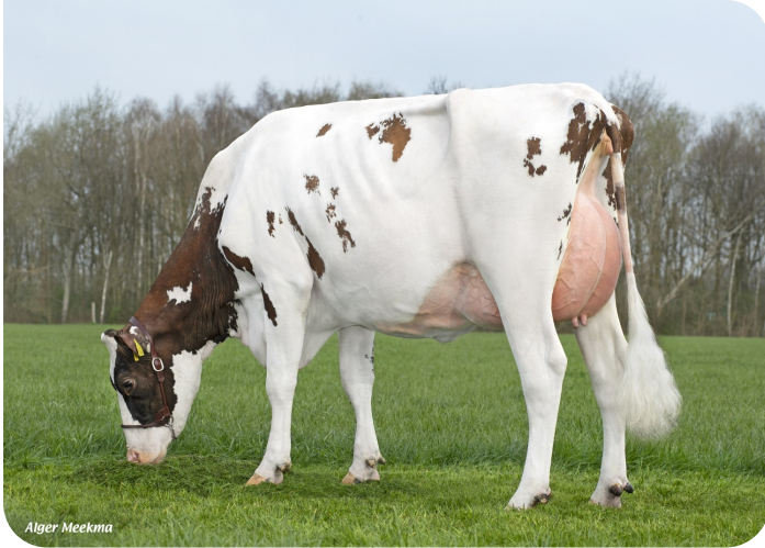
Grashoek Anna Jacoba 13 (V. Dex) Bes.: Fok- en melkveebedrijf K.I. SAMEN B.V., Grashoek (NL)