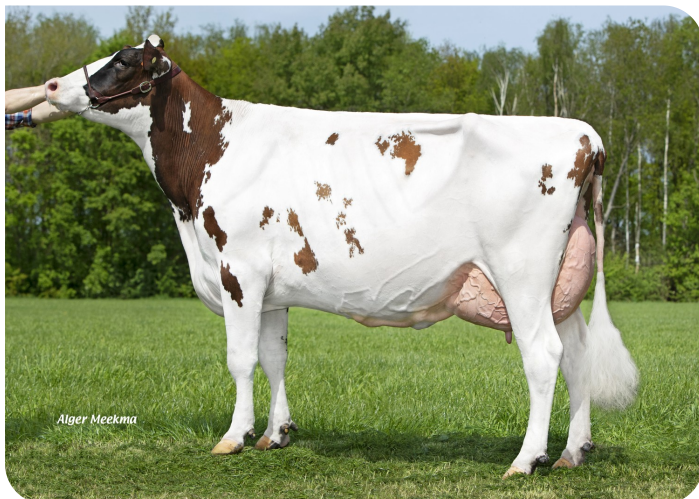
Grashoek Anna-Jacoba 13 (V. Dex)

Bes.: Fok- en melkveebedrijf K.I. SAMEN B.V., Grashoek (NL)