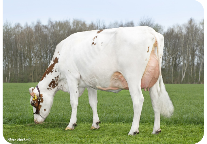
Grashoek Thrinicia 4 (V. Dex) Bes.: Fok- en melkveebedrijf K.I. SAMEN B.V., Grashoek (NL)