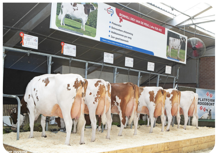
Tochtergruppe von Dex van de Peul Nationale Roodbont Show 2024, Mariënheem (NL)