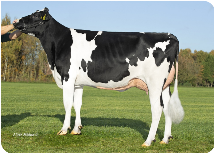
Grashoek Nordika 23 (VG 87)(V. Dex) Bes.: Fok- en melkveebedrijf K.I. SAMEN B.V., Grashoek (NL)