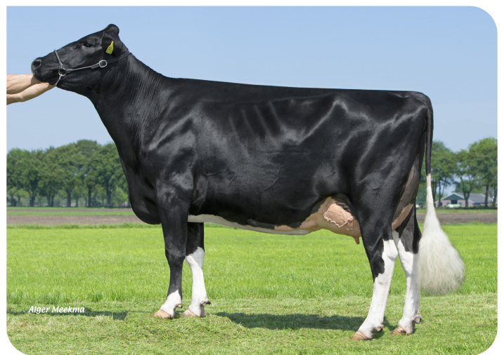
Big Anna Jacoba 126 (VG 87) (V. Shogun PS) (Vollschwester von Sentaro)