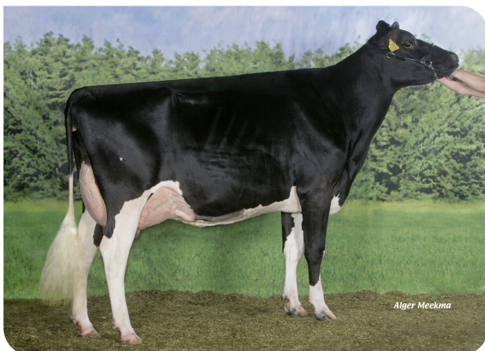
Big Anna Jacoba 115 (EX 90) (Mutter von Sentaro)