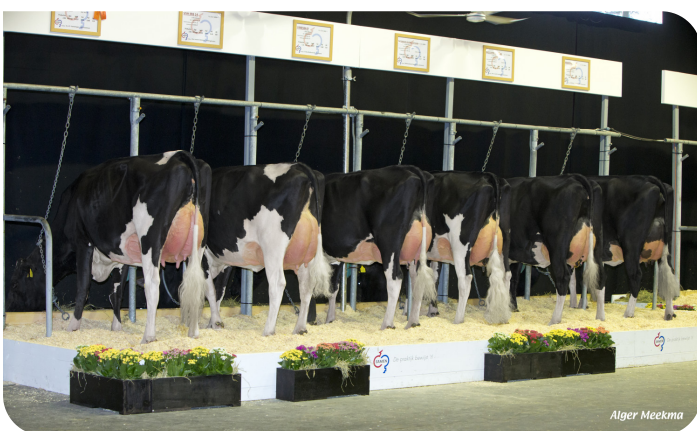
Malki Töchtergruppe NRM 2017