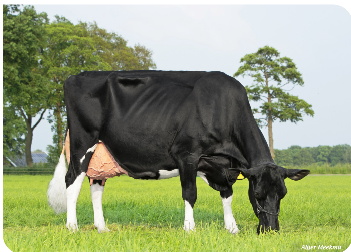
Geertje 669 (EX 92) (V. Malki)

Bes.: Melkveebedrijf Hammink VOF, Almelo (NL)