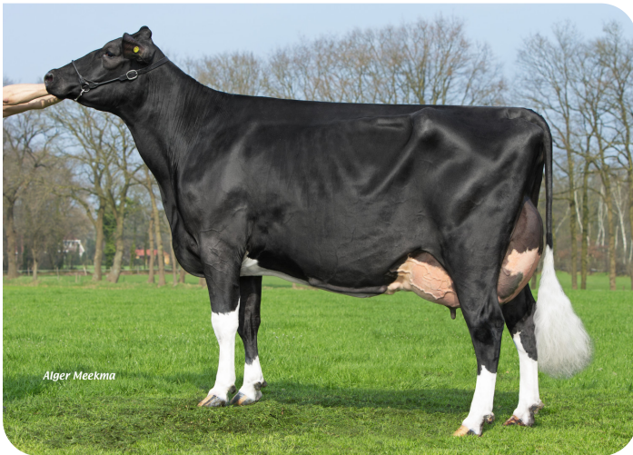
Maxima 2 (V. Malki) Bes.: Mts. Waterink, Beerzerveld (NL)