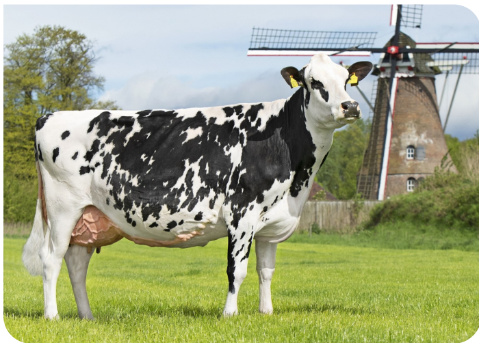
Bots Coba 39 (V. Malki) Bes.: Melkveebedrijf Bots, Rekken (NL)