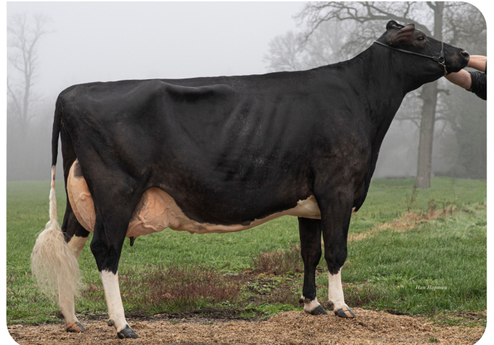
Sandra 2 (EX 92) (foto nach 5 Abkalbungen) (V. Malki) Bes.: Dhr. H.J. van de Riet, Markelo (NL)