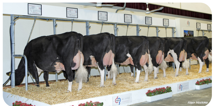
Malki Töchtergruppe NRM 2019