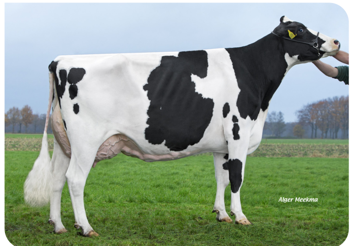
Big Elsie 7 (VG 89) Mutter von Macht