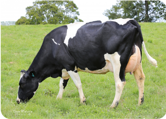
Akkersma Clyde Star (V. Clyde) Bes.: Akkersma (NZ)