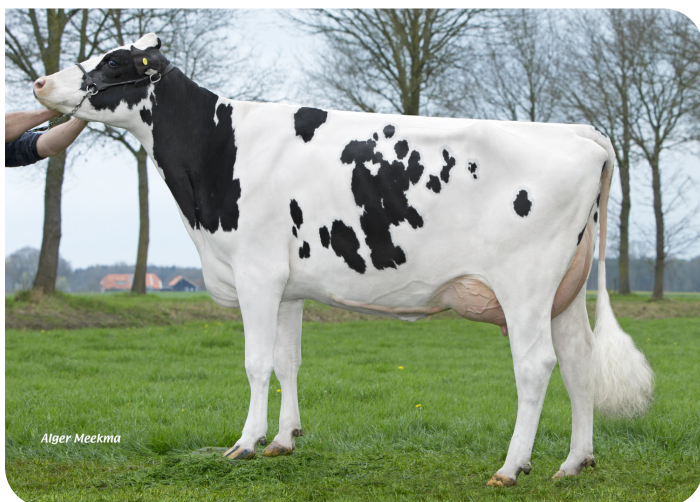
Sonja 99 (V. Clyde)