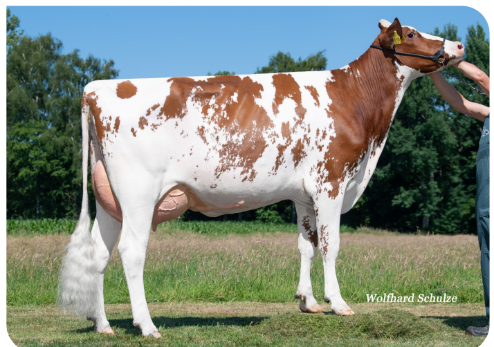
Hofdame (GP 84) (V. Andy-Red) Bes.: Gr. Klussmann, DE