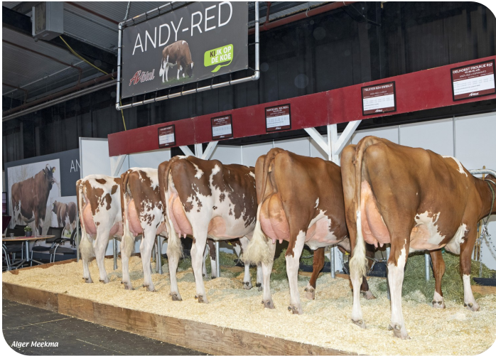
Nachzuchtgruppe Andy-Red, RMV Hardenberg 2022