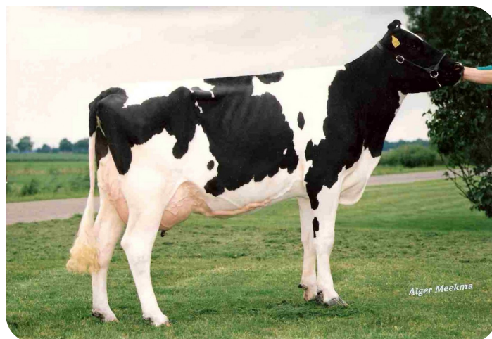
Batenburg Ginster 545 (VG 87) (Urugroßmutter von Red Ginstro)