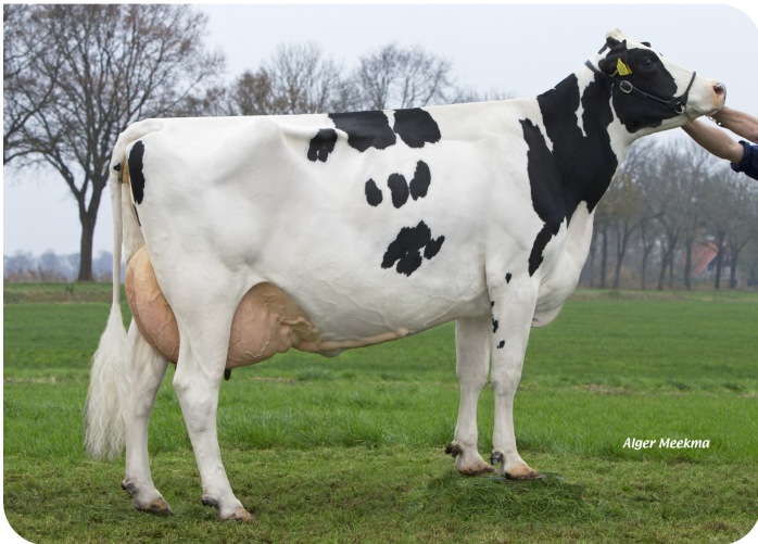
Batenburg Ginster 2047 RF (VG 89) (Mutter von Geronimo rf)