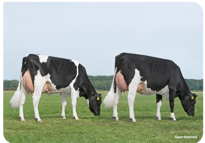
Etta 128 (l) und Etta 131 (r) (V. Geronimo) Bes.: R. & E. v.d. Ven-Scheepens, Vlagtwedde (NL)