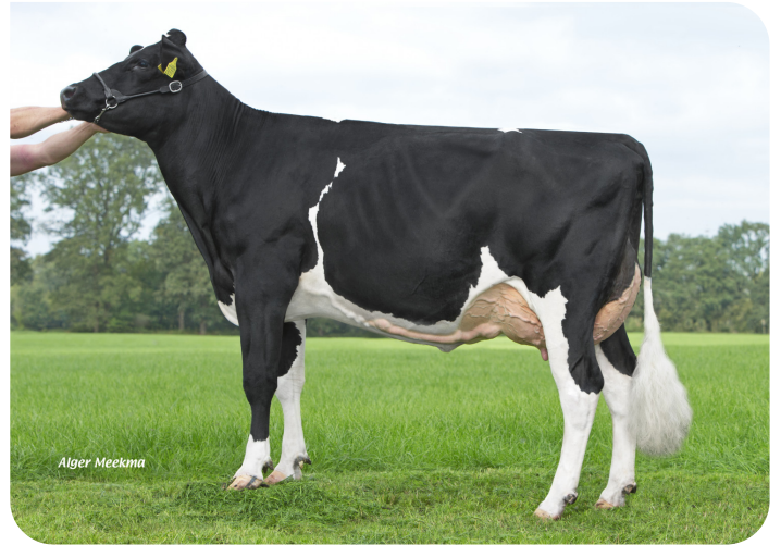
Bots Gusta 181 (V. Geronimo rf) Bes.: Melkveebedrijf Bots, Rekken (NL)