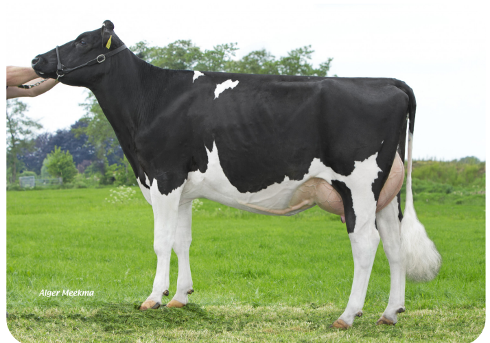
Catolien 93 (V. Archimedes rf) Bes.: Mts. van Dooren, Terschuur (NL)