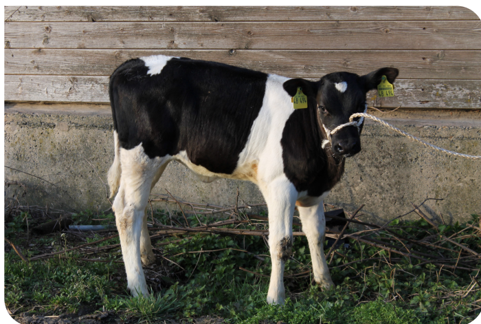
Annelie (V. Anne 6)