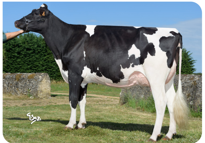
Suzy (V. Adlon P)