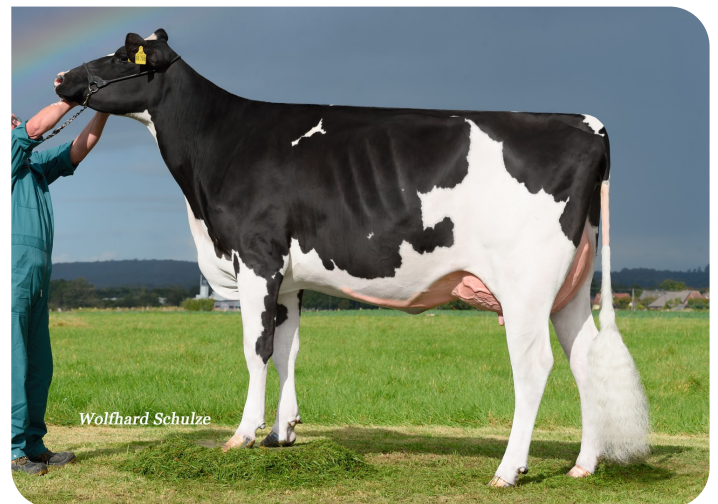
Adia (V. Adlon P)