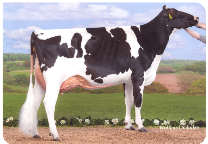
Rica (V. Adlon P)