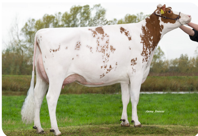
K&L Sk Konzert (VG 88) Großmutter von Sandor-P-Red